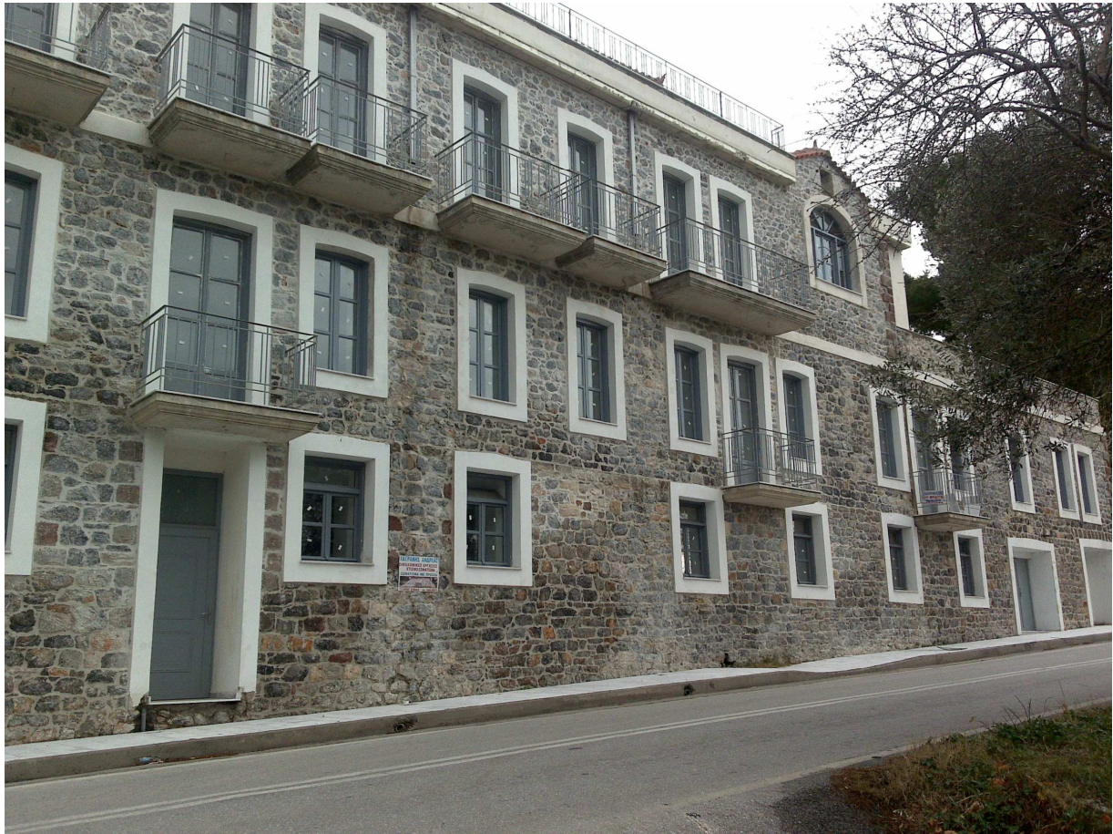
Μπροστινή όψη του κεντρικού κτιρίου του «Μυλωνοπουλείου» μετά την ριζική ανακαίνισή του

κάτοψη από τους δύο πρώτους. Βρίσκεται σε υψόμετρο 200μ. από την θάλασσα και σε απόσταση 4χλμ. από την Παραλία Κύμης.